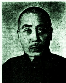
陈氏太极拳第十七代师傅 陈发科老师 (1887—1957)

17. generáció Chen Fa Ke (1887-1957) mester Chen Yang Xi három fia közül a legfiatalabb volt. Hírnevét fiatalkori győztes harcaival vívta ki. 1928-ban unokaöccse Chen Zhao Pi hívására Pekingbe ment, ahol újabb győzelmei tovább növelték tekintélyét. Ezután megnyitotta első edzőtermét Pekingben.